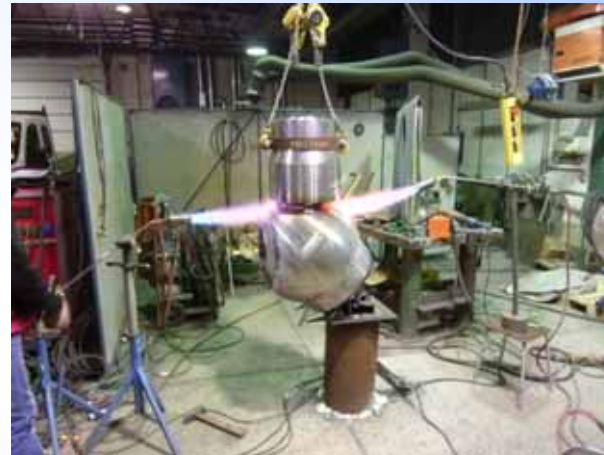
Einrichten und Abheften der Einzelteile unter Vorwärmung.