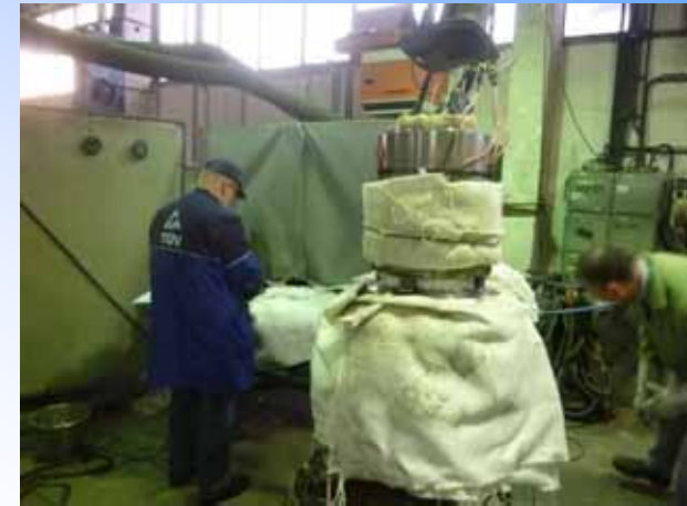
Kantenversatzkontrolle und Freigabe zum Schweißen mit BS und VE-G an der ersten Naht.