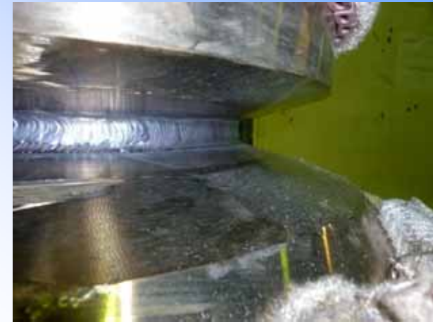
Beginn der Schweißarbeiten und visuelle Kontrolle der Wurzellage.